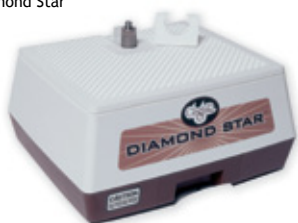
G141 Diamond Star