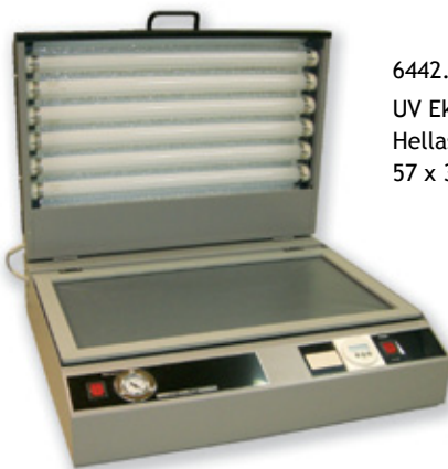
6442.105.002 UV Eksponeringsenhet, Hellas, med vakum, 57 x 30 cm