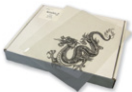
6441.105.001 AccuBlack A-4, Transparent skrivefilm, 100 ark

For mer info om gluechipping, se www.glassforum.no .