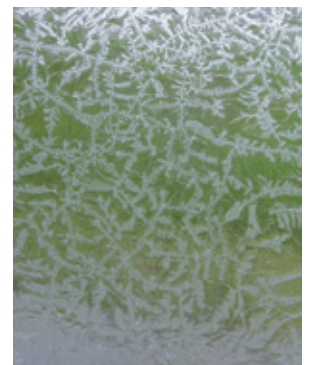
6461.008.001 Startpakke for Glue Chipping, inkl. instruksjonsbok (engelsk)