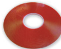
6811.104.010 Transparent dobbeltsidig tape, 1 mm tykk