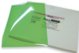
6441.105.6-050A25 RapidMask fotofilm, 50µ, 25 ark 0,21 x 0,30 meter