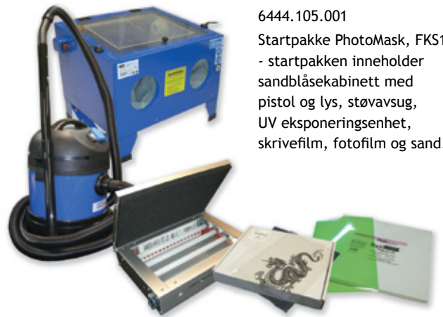
6444.105.001 Startpakke PhotoMask, FKS1 - startpakken inneholder sandblåsekabinett med pistol og lys, støvavsug, UV eksponeringsenhet, skrivefilm, fotofilm og sand.

Photoresist egner seg ypperlig for overføring av logoer, tekst og bilder og er svært arbeidsbesparende i tilfeller hvor man skal sandblåse mange eksemplarer av samme motiv.