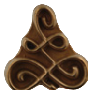
2198.090.003 Stempelhode for embossing, «Cursive»