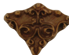
2198.090.008 Stempelhode for embossing, «Floral Corner»