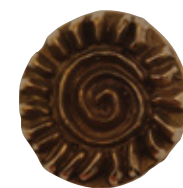
2198.090.012 Stempelhode for embossing, «Pacific Sun»