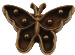
2198.090.002 Stempelhode for embossing, «Butterfly»