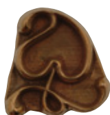
2198.090.006 Stempelhode for embossing, «Ivy Leaf»