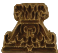
2198.090.014 Stempelhode for embossing, «Corinthian»