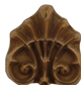
2198.090.007 Stempelhode for embossing, «Tiara»