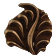
2198.090.004 Stempelhode for embossing, «Stylized Leaf»