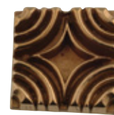
2198.090.016 Stempelhode for embossing, «Decor Quarter Circles»