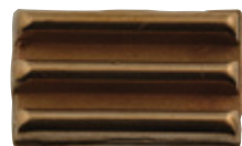
2198.090.010 Stempelhode for embossing, «Tribar»