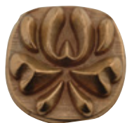
2198.090.001 Stempelhode for embossing, «Lotus»