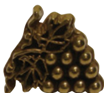
2198.090.018 Stempelhode for embossing, «Grapes»