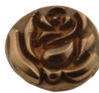
2198.090.011 Stempelhode for embossing, «Rose»