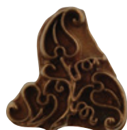
2198.090.005 Stempelhode for embossing, «Ivy Vine»