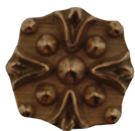
2198.090.009 Stempelhode for embossing, «Stylized Tulips»