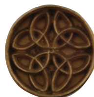
2198.090.0119 Stempelhode for embossing, «Circular Celtic»