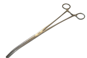
2190.090.011 Hemostat tang for glassarmbånd, 30 cm Tang for å ta ut og flytte en varm mandrel til en større ovn for avspenning.