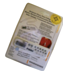
2190.090.021 Elektronisk timer En elektronisk timer med alarm er greit å ha for å følge med at det ikke går for lang tid når man skal lage armbånd.