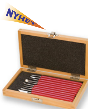
5131.115.001 Sett med 10 formeverktøy i treskrin Det ultimate verktøysettet for alle som arbeider med PMC. BRONZclay og COPPRclay.