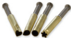
5131.086.303 Sett 4 stk. formskjærere, div. former