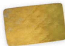
5131.086.021 Messingplate for avtrykk, "Swirl"