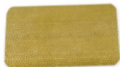
5131.086.011 Messingplate for avtrykk, "Small Pebbles"