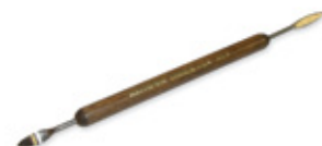
5131.086.411 Formeverktøy/Clean Up Tool