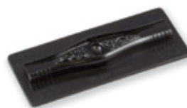
5150.086.011 Gummiform for signetring