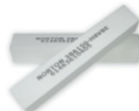
6203.017.150 Alundum slipestein 150 grit