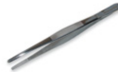
3133.056.001 Pinsett, rustfritt stål, 15 cm