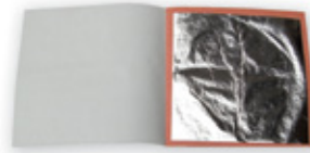
7604.017.011 Sølvfolie, 25 ark, 8x8 cm