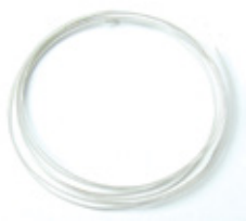
4231.017.001A Closisonne Wire, rent sølv, flat, 18 gauge, 4 fot