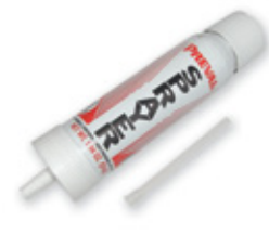
2353.017.001 Drivgass til Preval sprøytepipstol