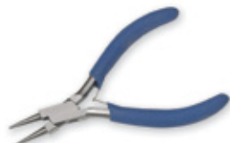
4241.017.001 Tang for metallarbeid, rund nese