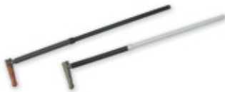
2781.017.101 Linjesikt, liten 1/32"