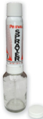
2352.017.001 Preval sprøytepipstol