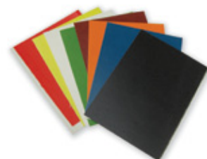
4221.017.SET Decalsett for emaljering, 8 farger, 7,5 x 10 cm av hver