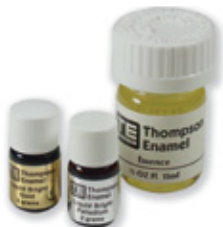
2769.017.001 Flytende gull, 2 gr