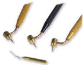
2737.051.001 Reservoirpenn for glassmaling og flytende metaller, standard

2737.051.101 Reservoirpenn, fin 2737.051.102 Reservoirpenn, grov