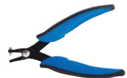
4241.115.001 Tang for å lage hull i kobberfigurer

4241.115.002 Reserve pin til tang 4241.115.001, 5 stk.