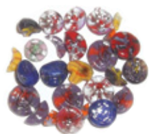
4216.017.102 Flower Buttons, 5 gr., ca 40-50 stk