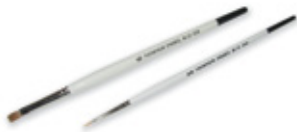
4246.017.001 Flatpensel for emaljer