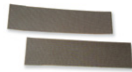
6202.017.0400 Diamant slipepapir 400 grit, 2,5x10 cm