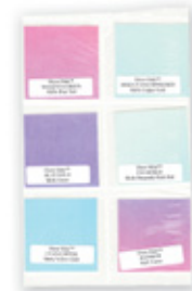
8634.111.SET Prøvesett Dichro Slides, en bit 5 x 5 cm av hver farge