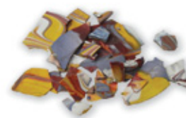
4216.017.004 Emaljefrit, Venetsiansk type, 227 gr.