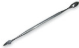
2782.017.001 Spatel, liten