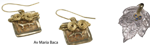
Av Maria Baca

Deltakerne vil i løpet av kurset lage minst 4 prosjekter. Det kan være både ringer, ørepynt, brosjer eller annet.